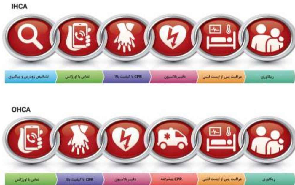
شکل ۱- زنجیره بقا بزرگسالان داخل و خارج از بیمارستان

زنجیره‌های بقای ایست قلبی داخل و خارج بیمارستانی در شکل ۱ نشان داده شده است.