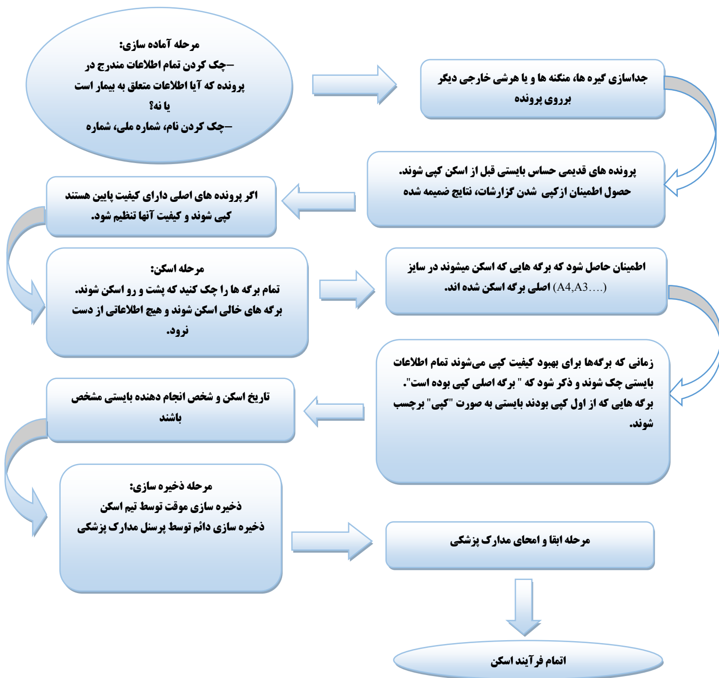
شکل ۲- نمایش مراحل فرآیند اسکن مدارک پزشکی (۱۸)

از ماشین‌های مخصوص و تشخیص ماشینی) توسط تیم اسکن‌کننده انجام شود. در اینجا نمونه‌ای از مراحل که بیشتر مورد استفاده قرار