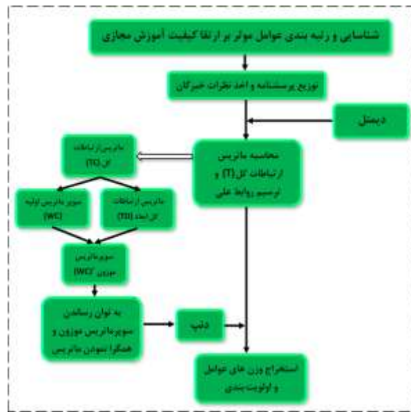
شکل ۱- مراحل پژوهش