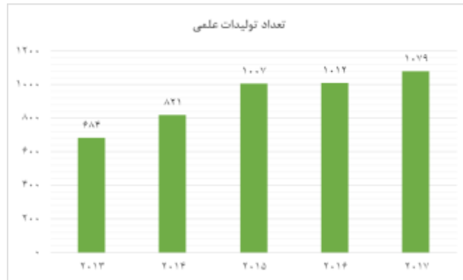
نمودار ۱- روند رشد توليدات علمی طی سال‌های ۲۰۱۳-۲۰۱۷

سهم توليدات علمی مربوط به سال ۲۰۱۳ با ۶۸۴ رکورد و بیشترین سهم مربوط به سال ۲۰۱۷ با ۱۰۷۹ رکورد می‌باشد.